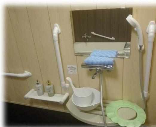
シャンプー・リンス 洗身用タオルなど