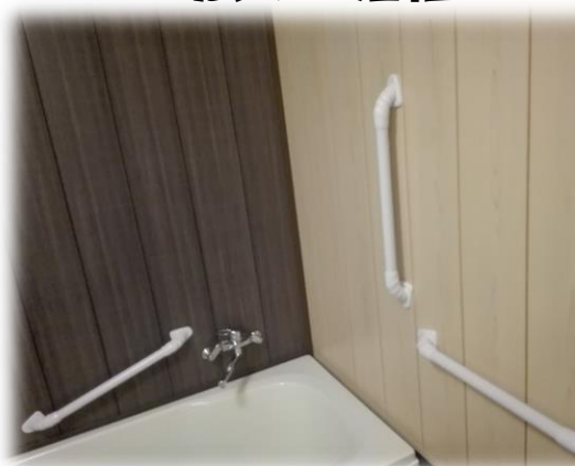
手すりも十分にあります