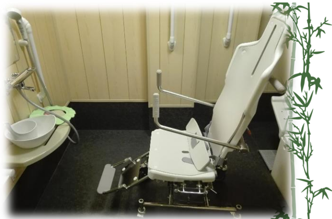
洗身・洗髪から浴槽に 浸かるまですべてできます