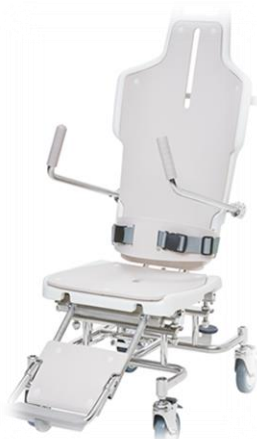
機械入浴用車椅子 に座ります