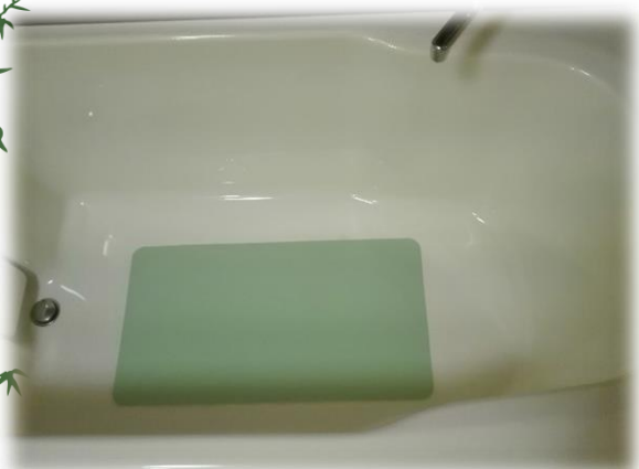
浴槽内のすべり止め