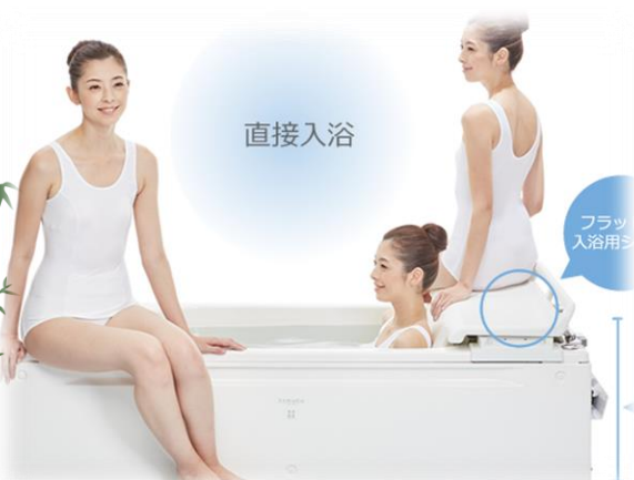
はつねで使う浴槽 OG技研の「テヌート」