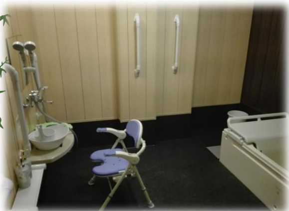
一般浴用の椅子と浴槽