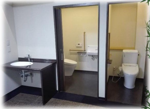
2つあるので安心です。