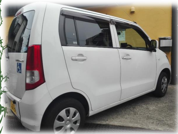
軽自動車の送迎車