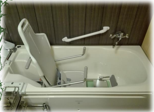
肩までつかれるように 下まで降りていきます。