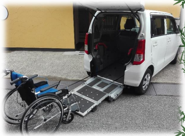
車いすのまま乗れます