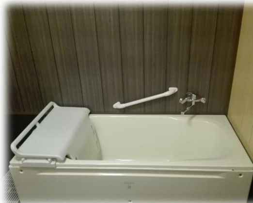
足を十分に伸ばせる 広々の浴槽