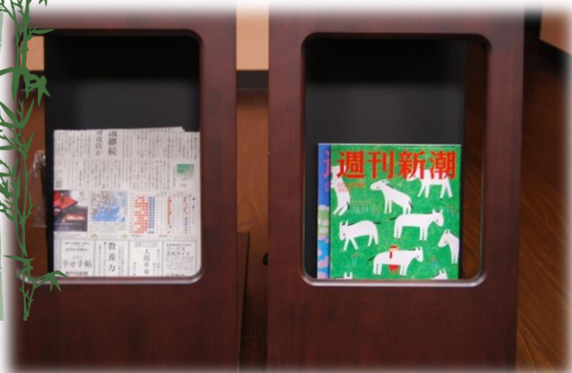
新聞と雑誌をご用意