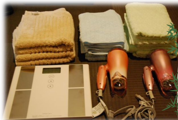
お風呂の備品にも こだわりました