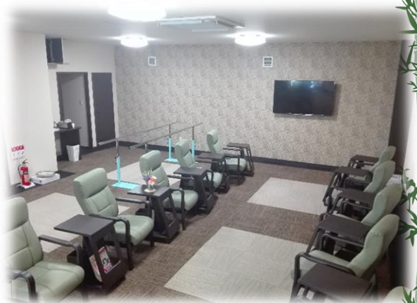
ゆったり和風のテイルーム