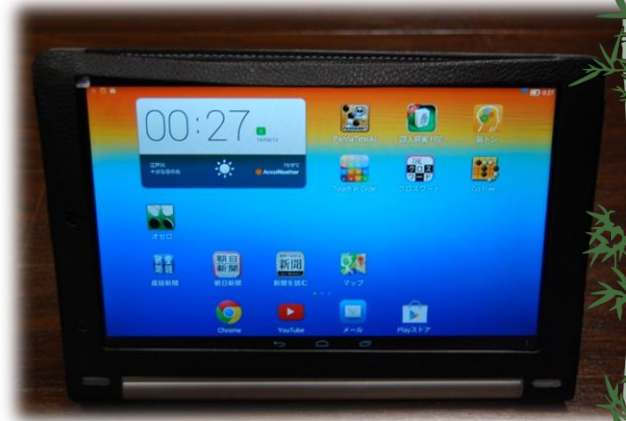
タブレットを使って ニュースや囲碁将棋も