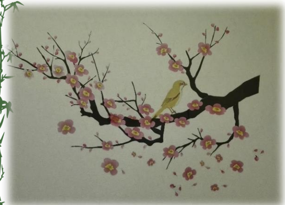
お手洗いでは鶯がお出迎え