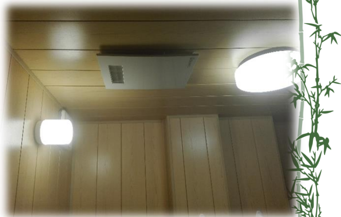
最新型浴室用エアコン 寒い思いはさせません