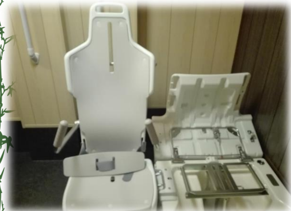
車椅子が浴槽の後部で ドッキング