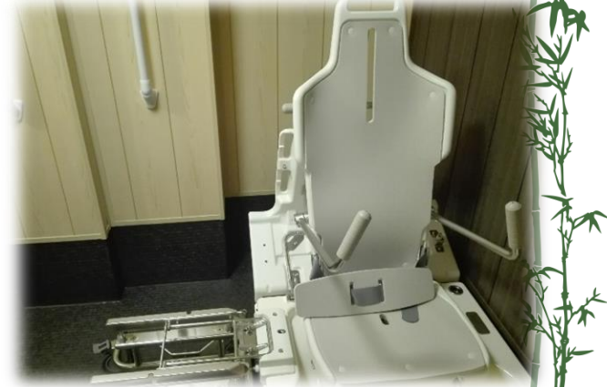
車椅子の上部が 横にスライドします。