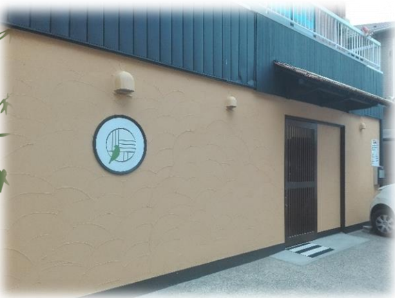
お蕎麦屋さんのような玄関