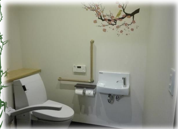
広々清潔なお手洗い