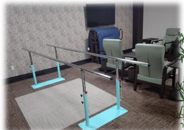
入浴前後平行棒で、 運動ができます。